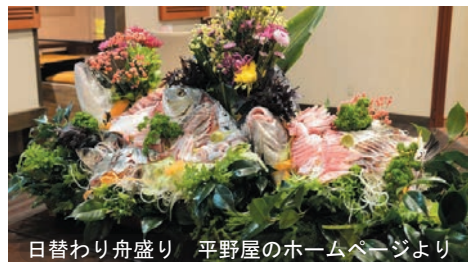
日替わり舟盛り